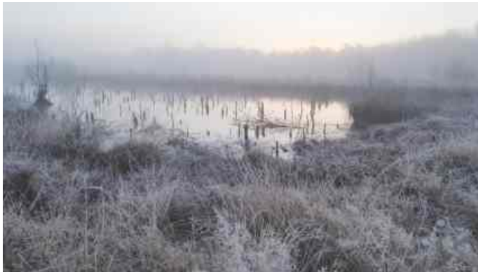
Das Venner Moor an einem kalten Wintermorgen. Um das Moor zu renaturieren, d.h. wieder zu vernässen, müssen regelmäßig Birken und Kiefern abgeholzt werden. Oder sollte man der „Natur“ freien Lauf lassen?